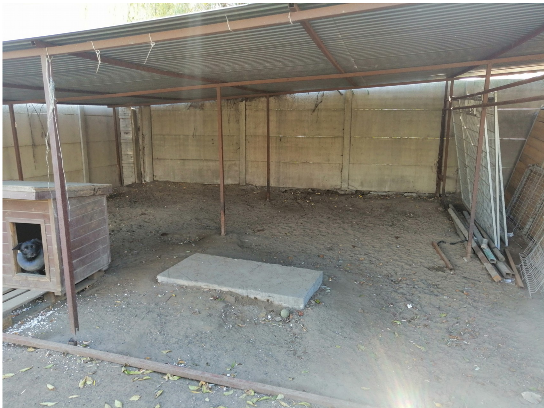
Teren przeznaczony na wylewkę betonową pod boksy oraz chodnik biegnący równoległe do niej (widoczne elementy konstrukcji metalowej zostaną usunięte przed rozpoczęciem inwestycji)