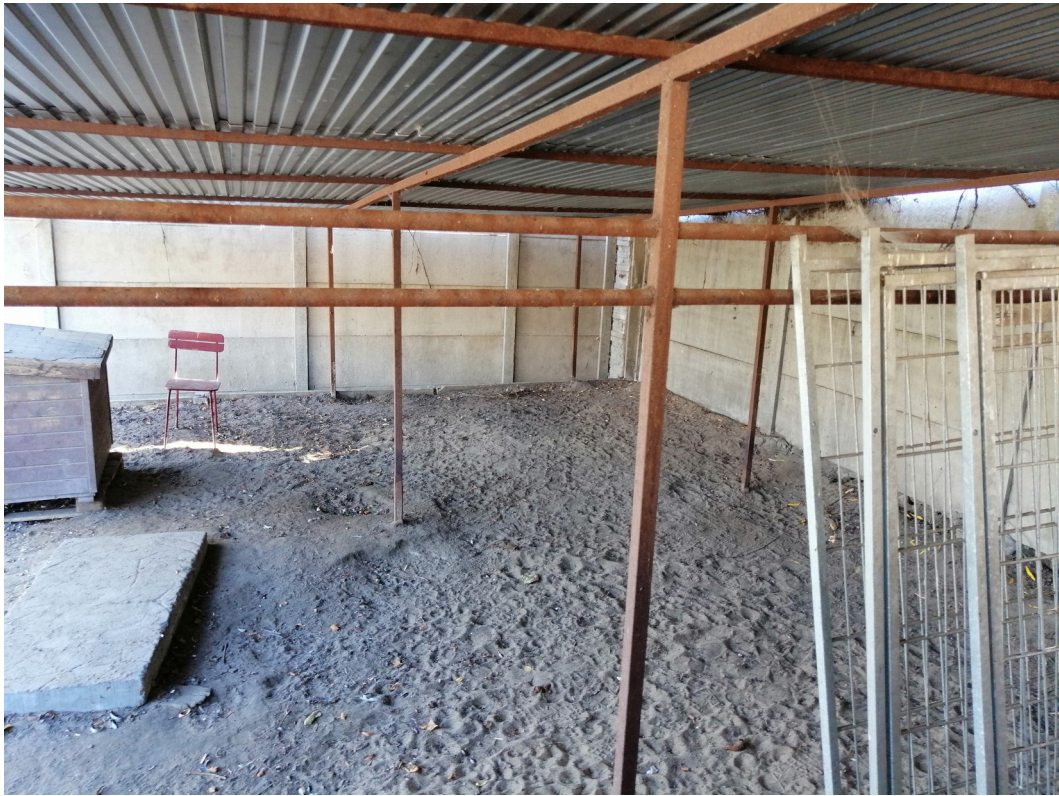
Teren przeznaczony na wylewkę betonową pod boksy oraz chodnik biegnący równoległe do niej (widoczne elementy konstrukcji metalowej zostaną usunięte przed rozpoczęciem inwestycji)