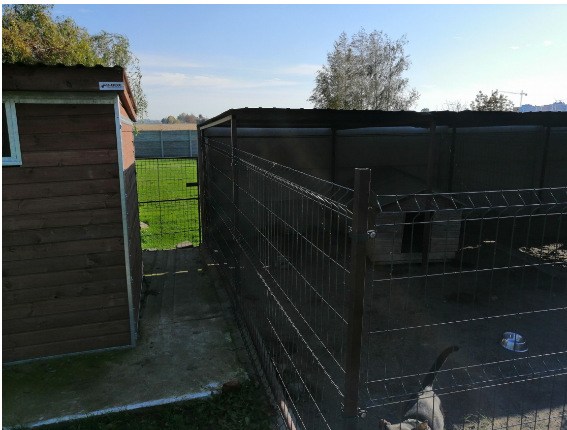
Ogrodzenie okalające istniejący wybieg – do demontażu i wymiany na nowe panele ogrodzeniowe metalowe wraz ze słupkami. Miejsce na montaż nowej furtki do wejścia na wybieg.