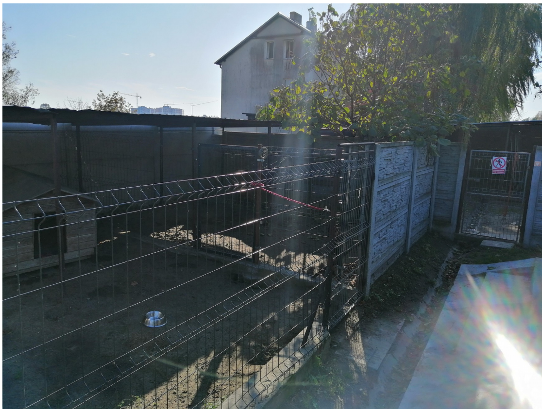
Ogrodzenie okalające istniejący wybieg – do demontażu i wymiany na nowe panele ogrodzeniowe metalowe wraz ze słupkami.