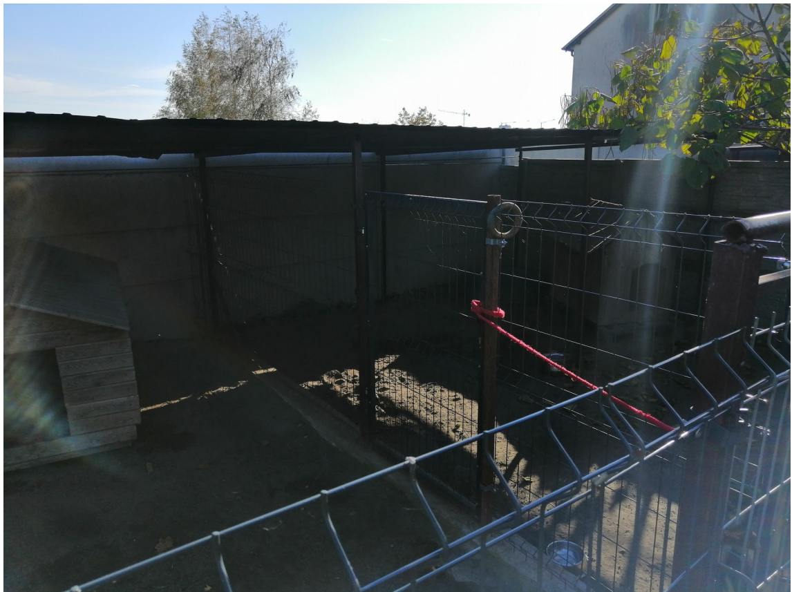
Druga ściana działowa (metalowa) w obrębie istniejącego wybiegu – do demontażu (widoczne elementy konstrukcji metalowej zostaną usunięte przed rozpoczęciem inwestycji)