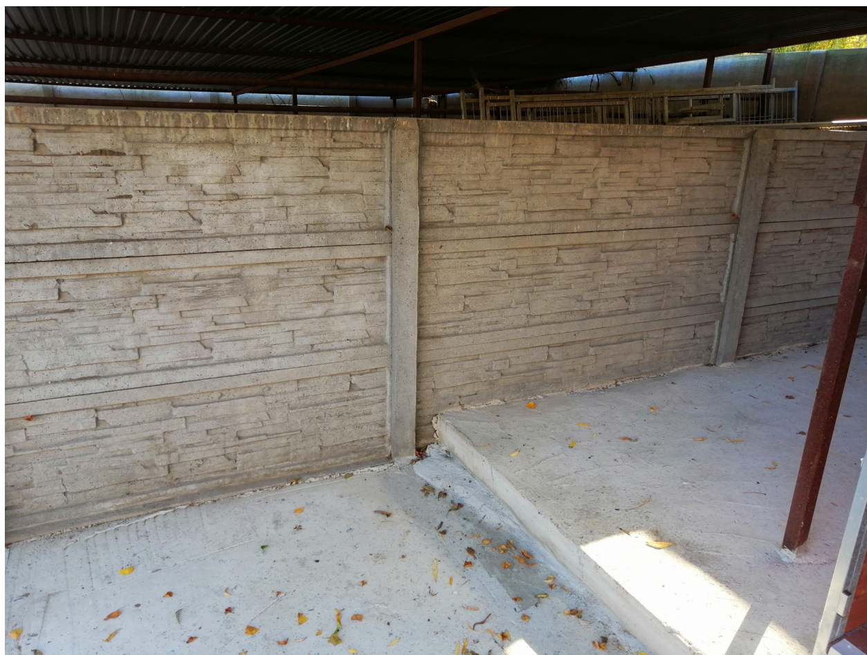
Ściana dzieląca obecną wylewkę betonową od nowej do wykonania. Miejsce na montaż jednej z dwóch furtek wejściowych na nowy wybieg.