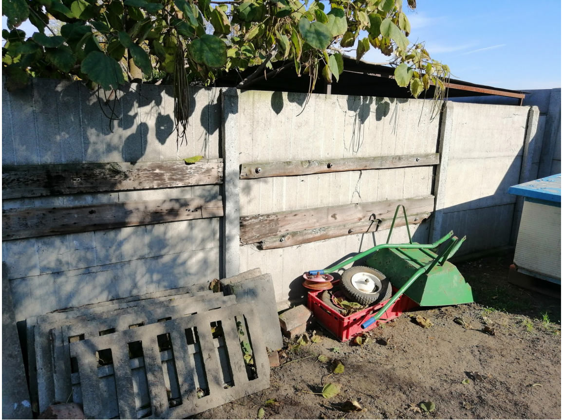
Ściana działowa w obrębie istniejącego wybiegu – do demontażu