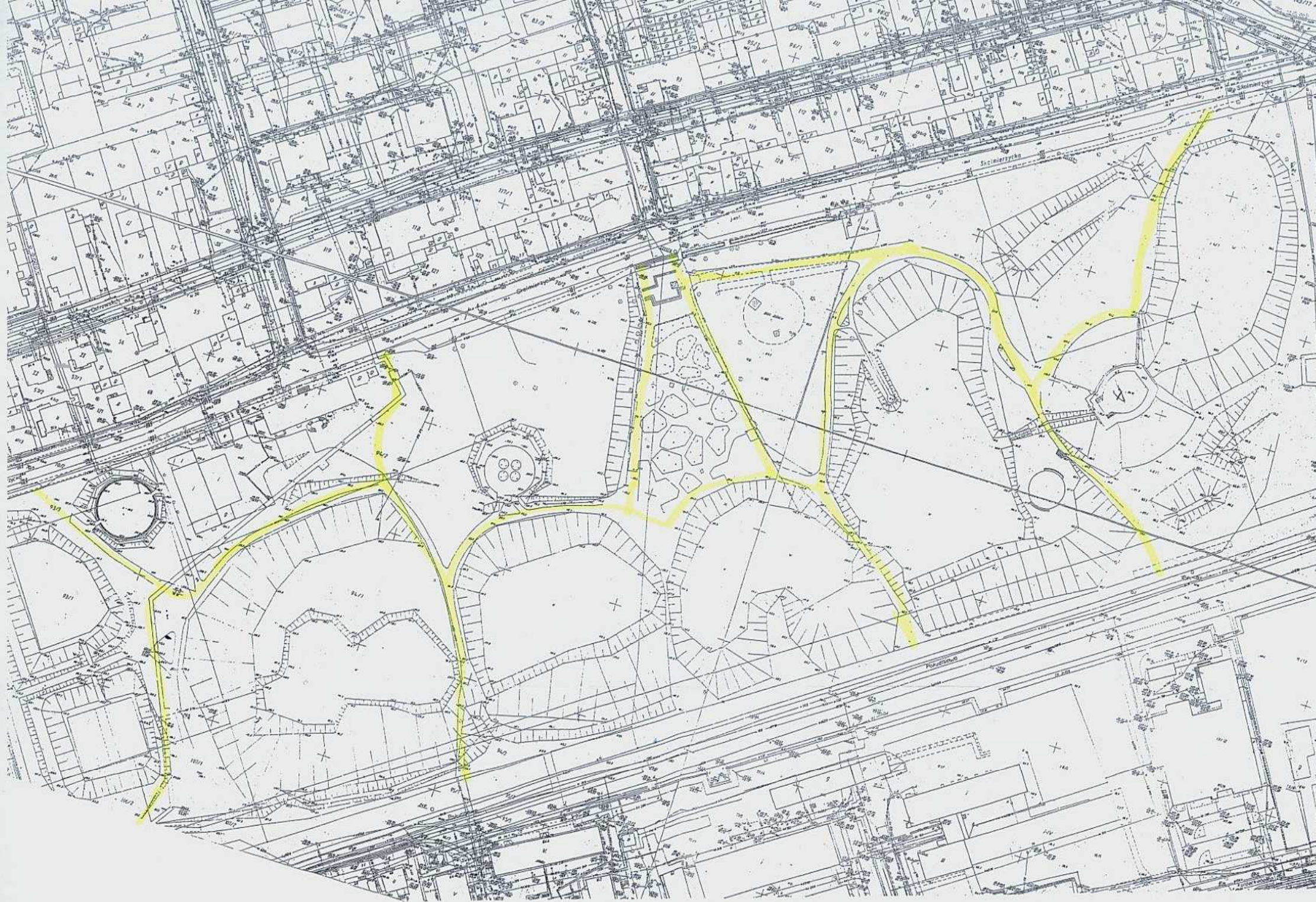
ŠIMONĚ UTRŽYMANÍE POKU PRYJAHNI