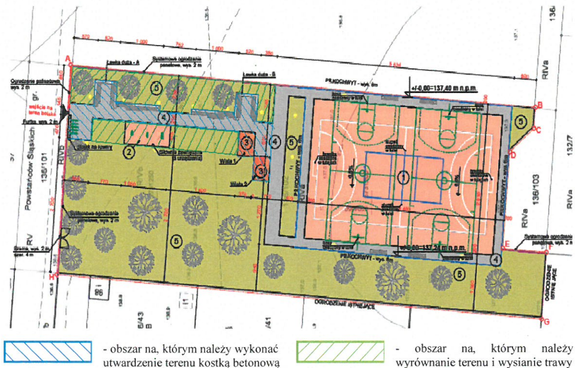
Rys. 1. Zakres utwardzenie terenu i obsiania trawą

Zakres robót do wykonania zobrazowany został na zamieszczonych poniżej rysunkach: