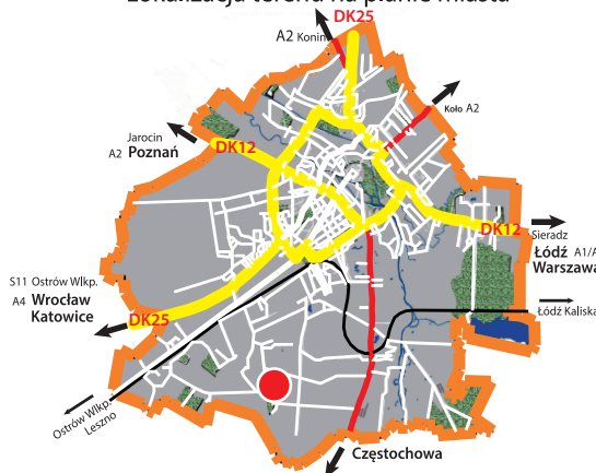
Lokalizacja terenu na planie miasta

OPIS TERENU : bardzo dobra lokalizacja dla usług i handlu. Teren położony na dynamicznie rozwijającym się osiedlu domów jednorodzinnych. Obsługa komunikacyjna terenu z projektowanej drogi lokalnej ul. Krajobrazowej lub istniejącej ul. Zachodniej.