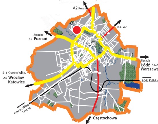
Lokalizacja terenu na planie miasta

Nieruchomość niezabudowana położona w przemysłowej dzielnicy Kalisza.