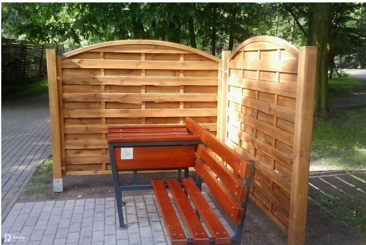
Konstrukcja drewniana we Wrześni