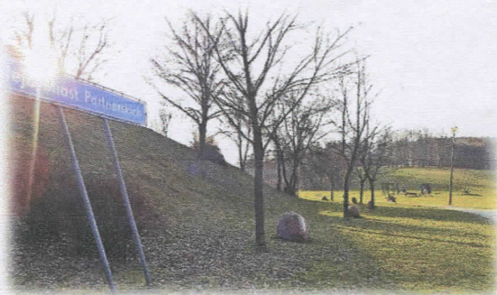
Przykładowe zdjęcie Alei w Lublinie